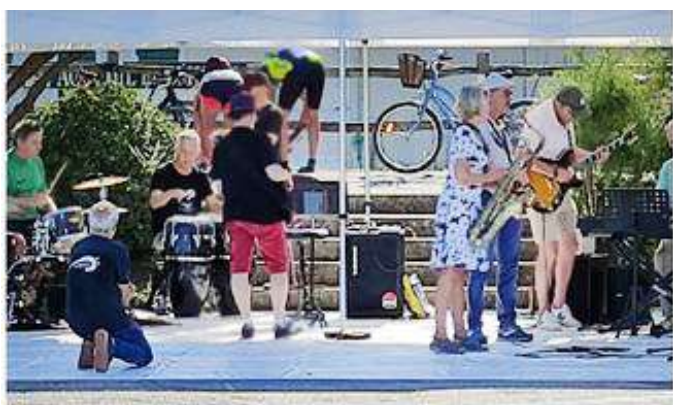
Jam session au Port des Salines de la 1ère masterclass